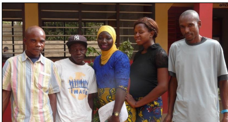
das neue Schulteam